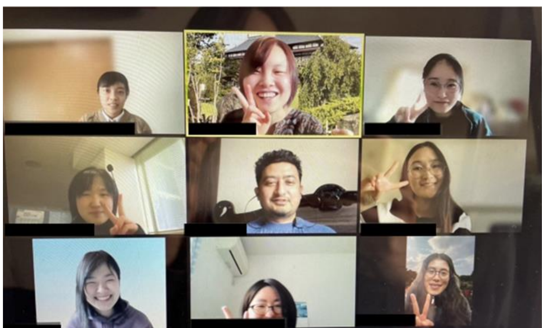
図1 English caféの様子(金曜日)

医学部GFL生や有志の学生により運営を行っている。毎回のEnglish café で参加者の名前を控えたり、様子を写真に収めている。運営委員は各曜日担当、イベント担当、メディア担当などに分かれて日頃活動を行っている。それぞれの担当の進捗報告を行うために月1回程度の定期的なミーティングを行っている。各曜日担当は先生や留学生の方との連絡役を担当し、各日程の実施内容を考え、また広報用のポスター作成を行い円滑な運営を行えるように活動している(図2・3)。イベント係はその季節にあったイベントを企画・運営している。