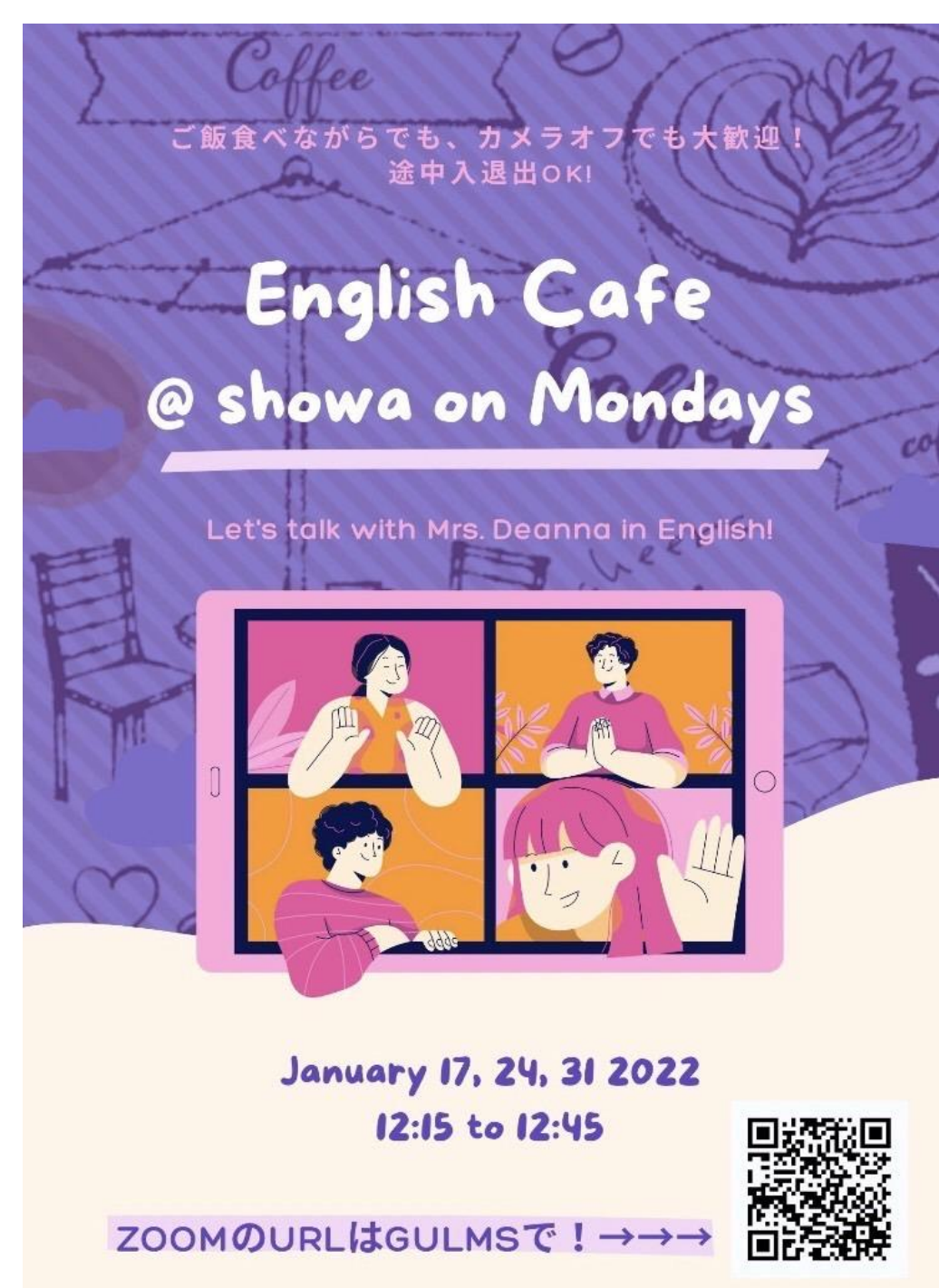
図2 実際の広報ポスター(月曜日)