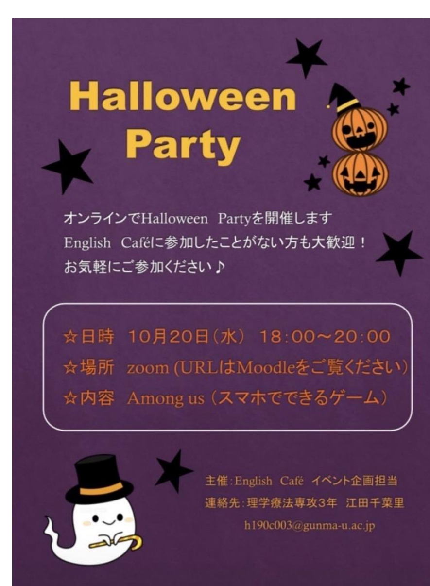
図4 実際の広報ポスター(イベント)

Halloween partyやChristmas partyでは多数の学生が参加しフリートークやamong usを行い楽しむことが出来た。Among usとはオンラインパーティーゲームであり、クルーは宇宙船でのタスク行いながらミッションを妨害するインポスターを見つけるゲームである。誰がインポスターであるかの話し合いや説明を英語で行うことで楽しく英語を学ぶことが出来た。